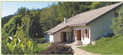
« La grange aux chouettes, notre gîte situé en plein cœur du Pilat. »