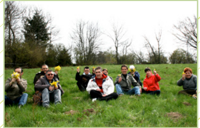
« 1er week-end, première réussite. »

Notre conviction ainsi que notre investissement sans faille en ce projet lui a permis de voir le jour et de faire que les premiers week-ends et sorties remportent un grand succès. »