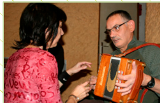
« Après un concert, rencontre avec les musiciens »

Handi-Cap Nature favorise la mixité des pratiques de loisirs entre personnes en situation de handicaps et personnes valides. Contribue à l'insertion et au respect des personnes dans les différents lieux fréquentés.