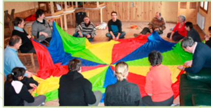
« la vie en groupe dans notre gîte »

Handi-Cap Nature contribue à l'épanouissement et à l'autonomie de la personne. Développe ou maintient les acquis. Favorise l'apprentissage de la vie de groupe et des règles sociales.