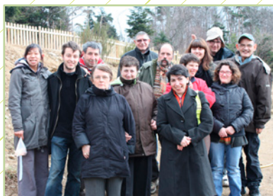
« Handi-Cap Nature ce sont des sorties et week-ends tout au long de l'année. »