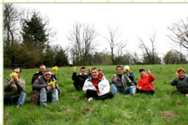
« 1er week-end, première réussite. »

Notre conviction ainsi que notre investissement sans faille en ce projet lui a permis de voir le jour et de faire que les premiers week-ends et sorties remportent un grand succès. »