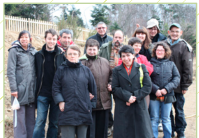
« Handi-Cap Nature ce sont des sorties et week-ends tout au long de l'année. »