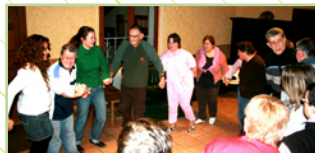
« Tous nos séjours se déroulent dans une ambiance festive et familiale. »

Bien entendu, le principal objectif de toute sortie Handi-Cap Nature est que chacun passe un séjour agréable dans la joie et la bonne humeur.